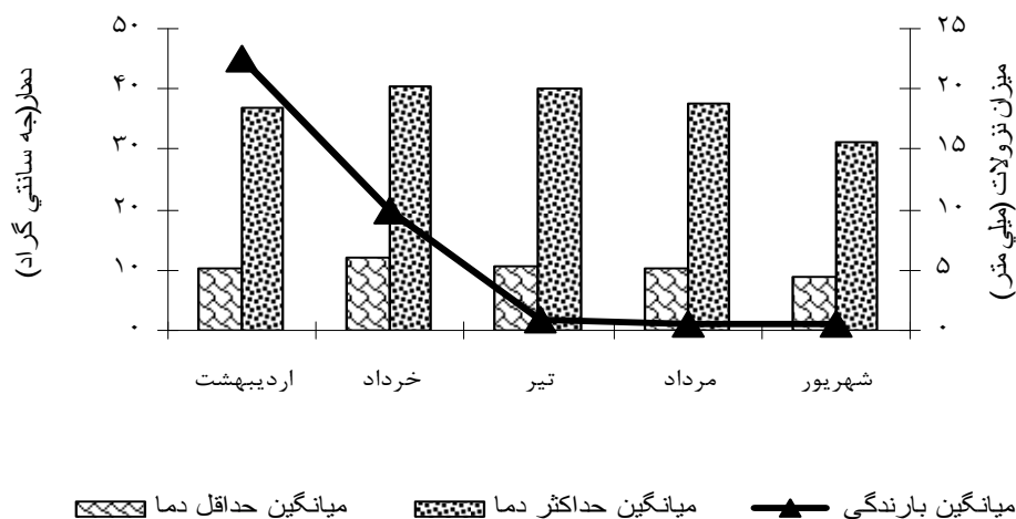
شکل ۱- متوسط حداقل و حداکثر دما و میزان بارندگی ماهانه ثبت شده در طی فصل رشد

آزمایشی شامل پنج ردیف کاشت به طول پنج متر با فاصله بین ردیفی ۶۰ سانتی متر و تراکم ۱۲ بوته در متر مربع (که تراکم مطلوب و توصیه شده برای کشت سورگوم علوفه ای رقم اسپید فید در منطقه است) در نظر گرفته شد. فاصله بین واحد های آزمایشی به صورت دو ردیف نکاشت در نظر گرفته شد. فاصله بین بلوک های آزمایشی از همدیگر ۱/۵ متر در نظر گرفته شد. رقم اسپید فید از شرکت خدمات حمایتی کشاورزی اردبیل تهیه گردید. این هیبرید جزو انواع زودگل است و در شرایط آب و هوایی سرد،