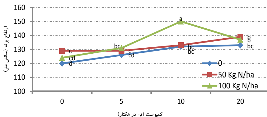
شکل ۱- اثرات متقابل نیتروژن و کمپوست بر ارتفاع بوته